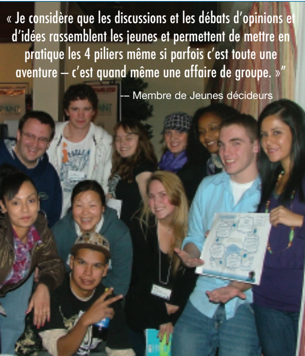
*Les quatre piliers de la Commission des étudiants sont Respecter, écouter, s'entendre et communiquer™.